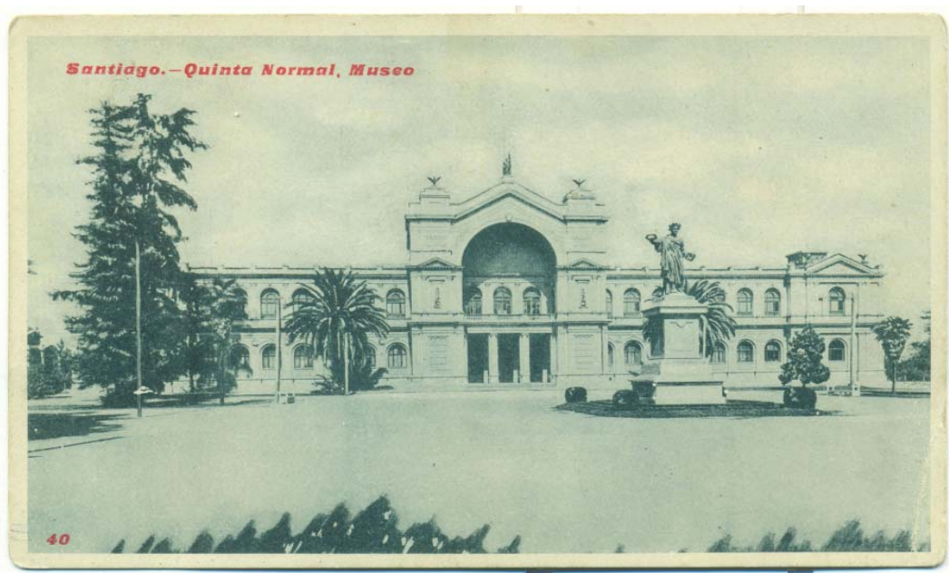
FIGURA 10. Postal sobre la Quinta Normal de Agricultura con la imagen del Museo Nacional.