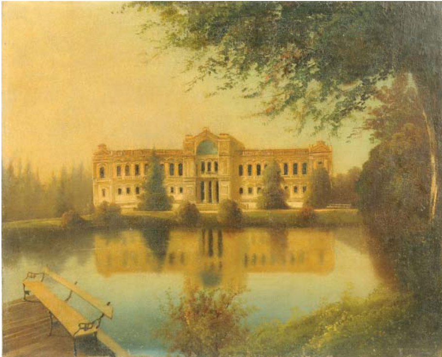
FIGURA 8. Edificio del Palacio de la Exposición. Óleo sobre tela del artista Burke.