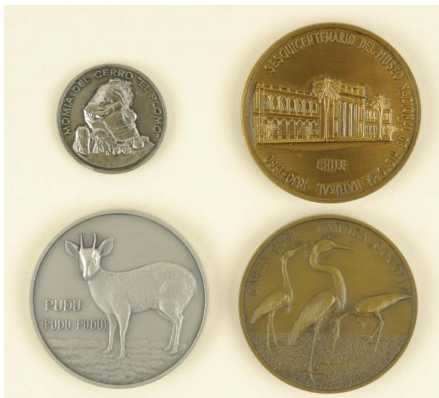
FIGURA 11. Anverso y reverso de las medallas conmemorativas del Museo Nacional de Historia Natural.