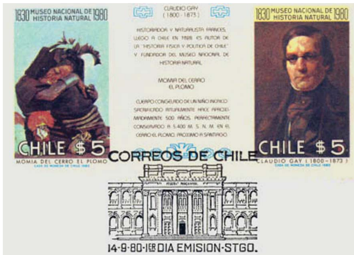
FIGURA 12. Matasello de Correos de Chile (1980)

Dentro de los otros usos que se han realizado de la imagen actual de este edificio tiene que ver con la utilización institucional de él, sobre todo en tarjetería y dípticos, debiéndose mencionar quizás como un uso extraordinario, la confección de diez platos de cobre con esmaltado negro con la imagen del frontis del Museo y con la leyenda “Museo Nacional de Historia Natural fundado en 1830 Santiago-Chile” con firma de autor Milled, ya que dichos platos terminaron siendo adquiridos por funcionarios del Museo, constituyéndose finalmente en piezas únicas (Figura 13).