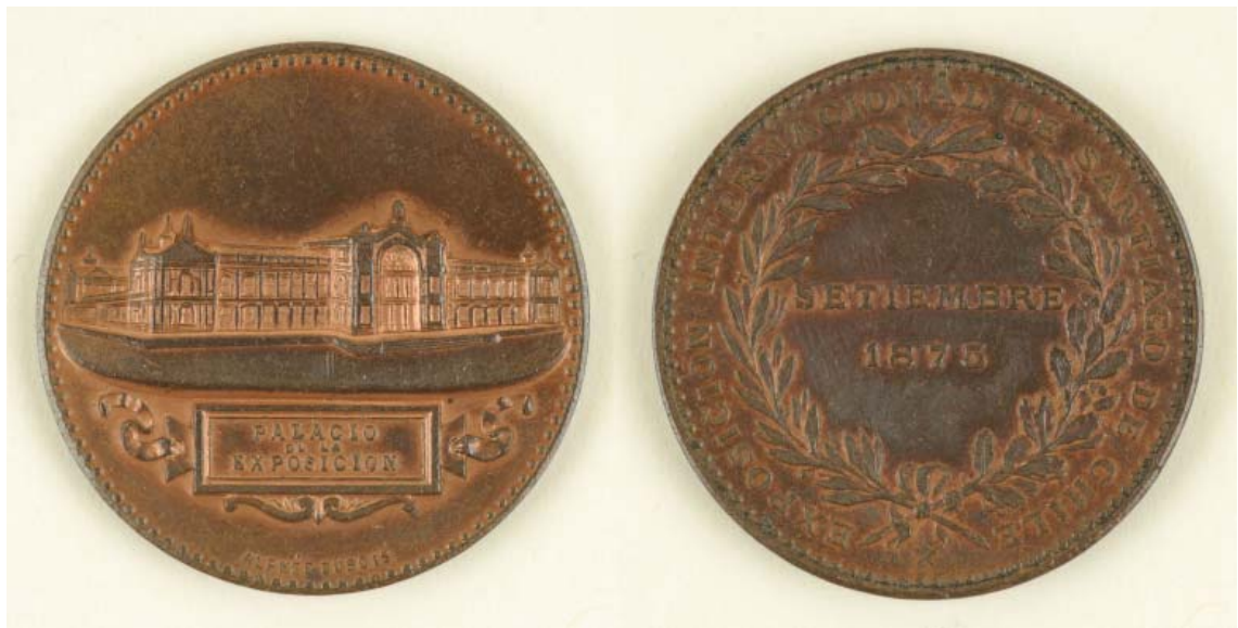
FIGURA 5. Anverso y reverso de la medalla de la exposición internacional de 1875 (Colección particular).