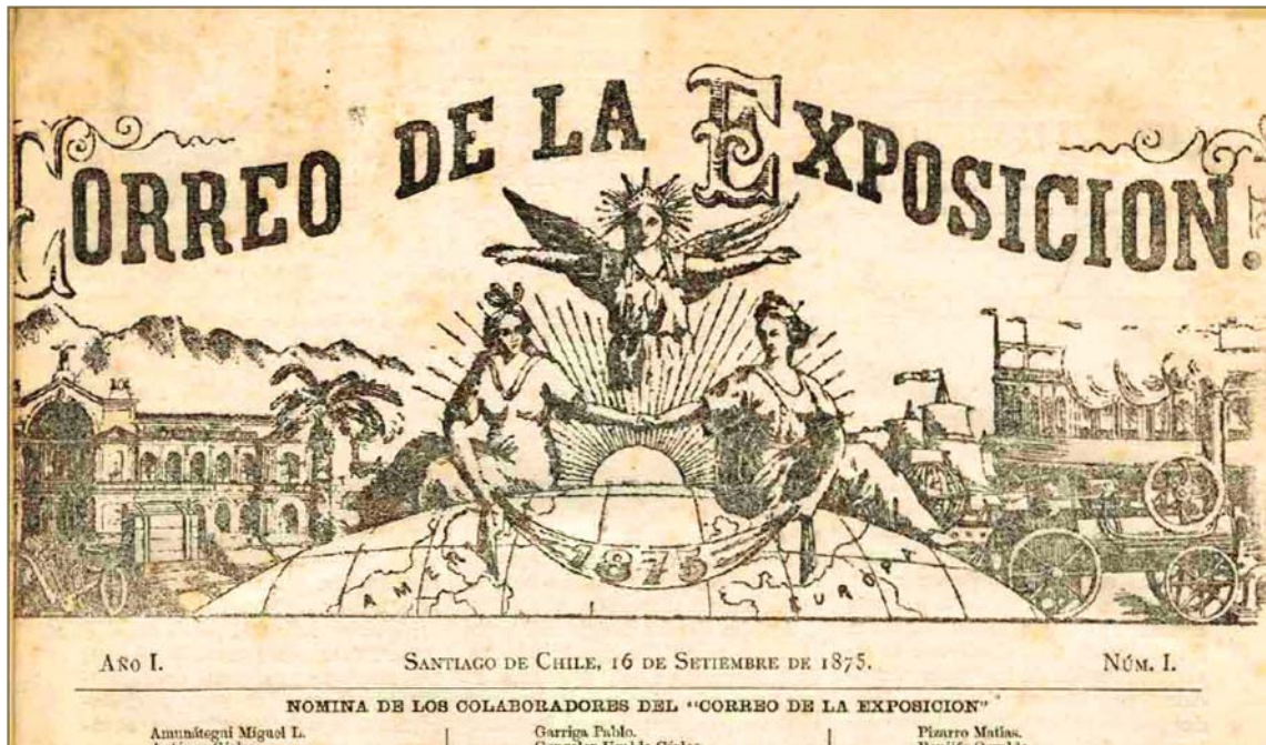
FIGURA 4. Parte de la portada del correo de la exposición