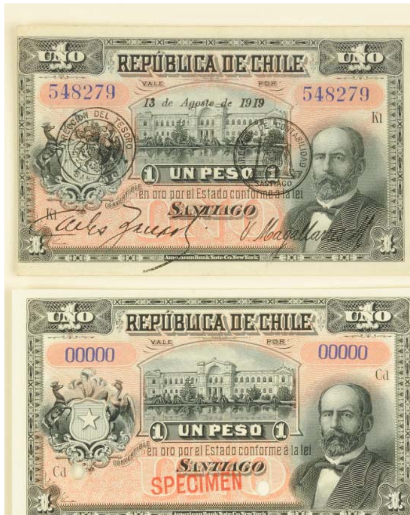
FIGURA 6. Especimen y billete de 1 Peso (1919)

La majestuosidad del edificio unida al reconocimiento que se le brindaba al Museo Nacional entre los ciudadanos cultos del país, se tradujo en que se convirtiese por más de veinte años en uno de los elementos iconográficos de los billetes de un peso que circularon en Chile entre los años 1880 y 1919, generándose toda una serie de billetes con la imagen del Museo Nacional (Figura 6).