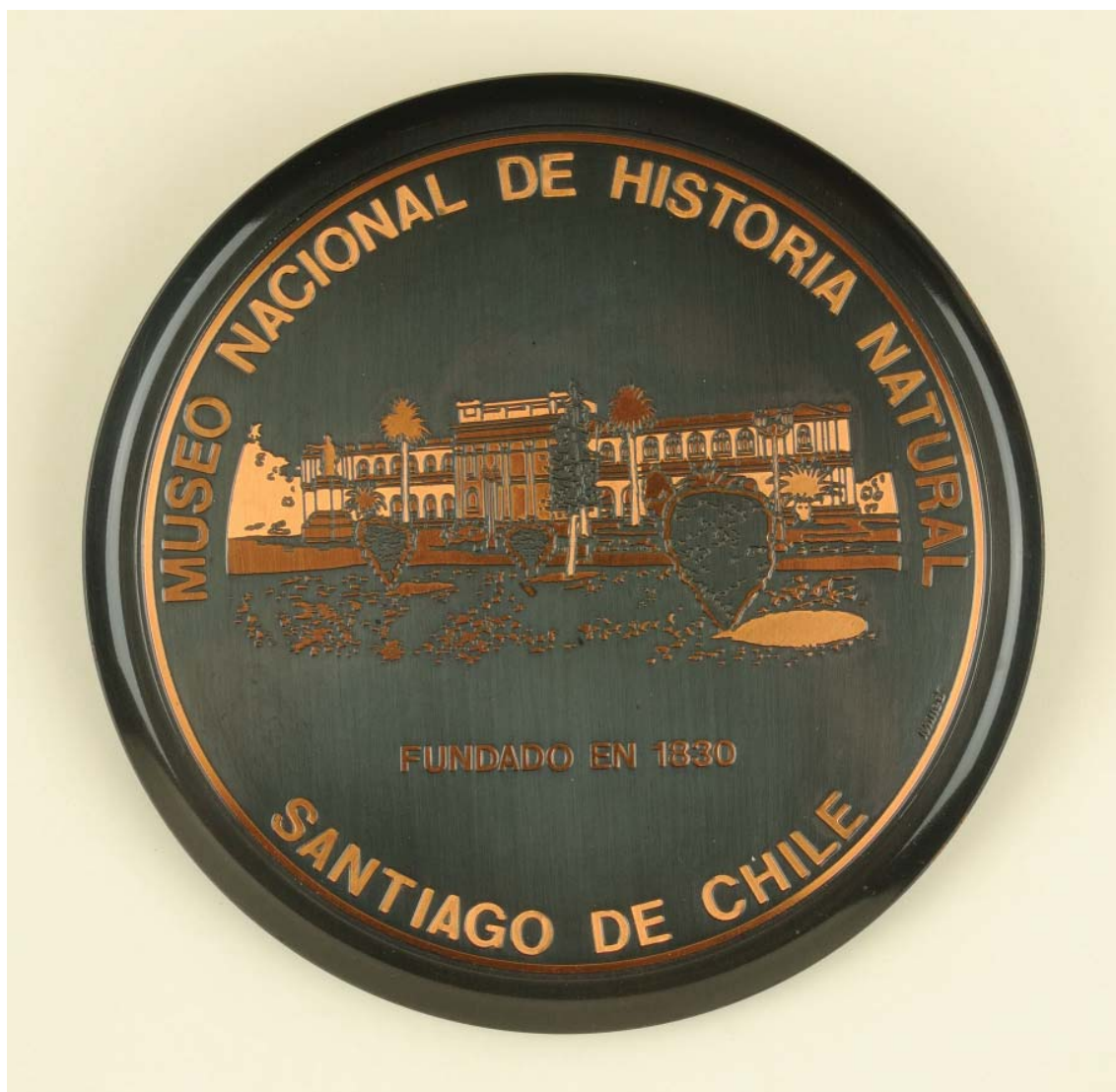
FIGURA 13. Plato con la imagen del frontis del Museo Nacional de Historia Natural

que se refleja en las diversas instancias en que fue utilizado como una de las imágenes de instituciones u obras arquitectónicas chilenas importantes.