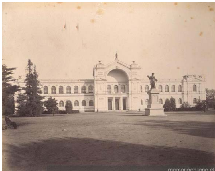
FIGURA 1. Antigua fachada del edificio del Museo Nacional del Historia Natural (1890)