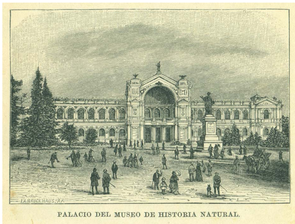
FIGURA 7. Palacio del Museo Nacional editada en Leipzig en 1901.

De la importancia que se otorgaba al Museo Nacional en la cultura del país es muestra el grabado del frontis del Palacio que sirve para ilustrar el capítulo sobre “Instrucción Pública” en una publicación sobre Chile editada en Leipzig en 1901 (Figura 7).