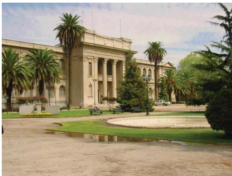
FIGURA 2. Fachada actual del edificio del Museo Nacional de Historia Natural