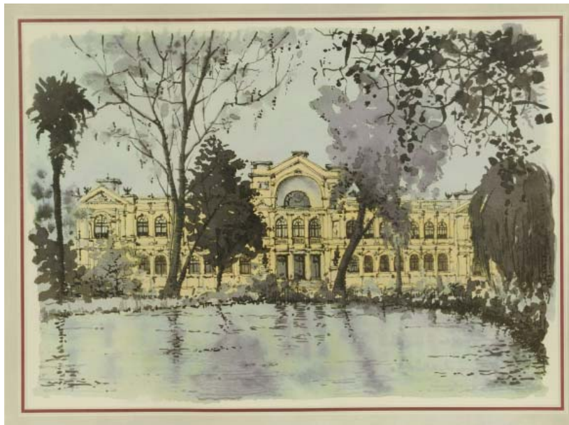
FIGURA 9. Edificio del Palacio de la Exposición. Acuarela de autor desconocido.