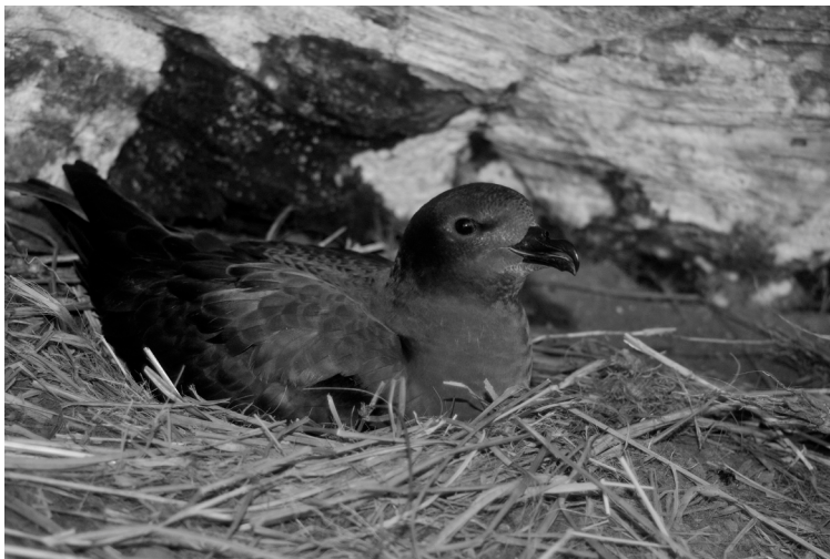
FIGURA 4.- Adulto en nido del Petrel de Henderson ( Pterodroma atrata) en Motu Nui.