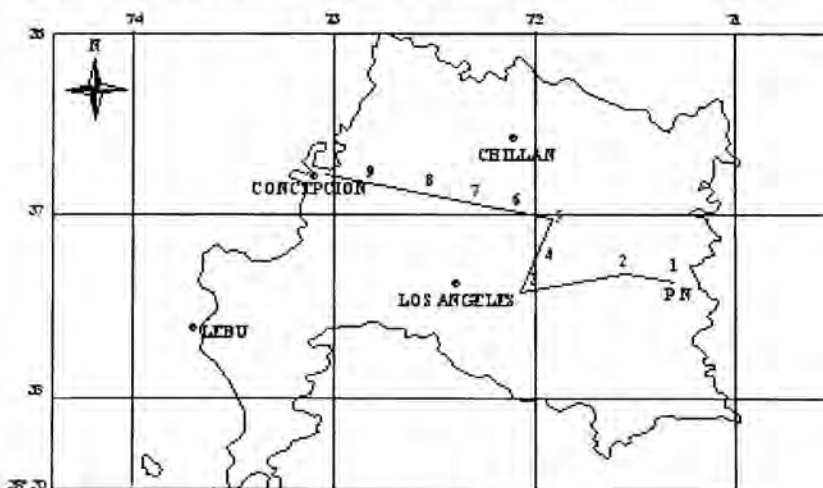
FIGURA 1. Ubicación geográfica del trazado de caminos en la Octava región de Chile en la que se realizó el muestreo. Los puntos indican localidades detalladas en la metodología. (PN) Parque Nacional Laguna de la Laja.

El área de estudio (figura 1) se encuentra en la Octava Región de Chile. El muestreo se realizó en el borde de caminos seleccionados con orientación este - oeste, entre la cordillera de la costa y la cordillera de los Andes, a la latitud de la ciudad de Concepción ( 37^{\circ} 22' S ; 71^{\circ} 16' W ). El trazado se dispuso en la ruta caminera entre Agua de la Gloria (15 km al este de Concepción) y el punto de mayor altitud en el trazado (1.330 m.s.n.m.), próximo al lago Laja en la cordillera de los Andes; las siguientes localidades sirven como referencias intermedias: Agua de la Gloria 9 ( 36^{\circ} 49' S ; 72^{\circ} 52' W ), Tomeco 8 ( 36^{\circ} 59' S ; 72^{\circ} 37' W ), Cabrero 7 ( 37^{\circ} 02' S ; 72^{\circ} 24' W ), Cholguán 6 ( 37^{\circ} 04' S ; 72^{\circ} 23' W ), Huepil 5 ( 37^{\circ} 14' S ; 71^{\circ} 36' W ), Tucapel 4 ( 37^{\circ} 17' S ; 71^{\circ} 56' W ) Canteras 3 ( 37^{\circ} 20' S ; 72^{\circ} 18' W ), Antuco - Pueblo 2 ( 37^{\circ} 20' S ; 71^{\circ} 41' W ). Antuco - Volcán 1 ( 37^{\circ} 30' S ; 71^{\circ} 25' W ). 15 km del trazado (Yungay a Canteras) se disponen en sentido norte - sur en la Depresión Intermedia.