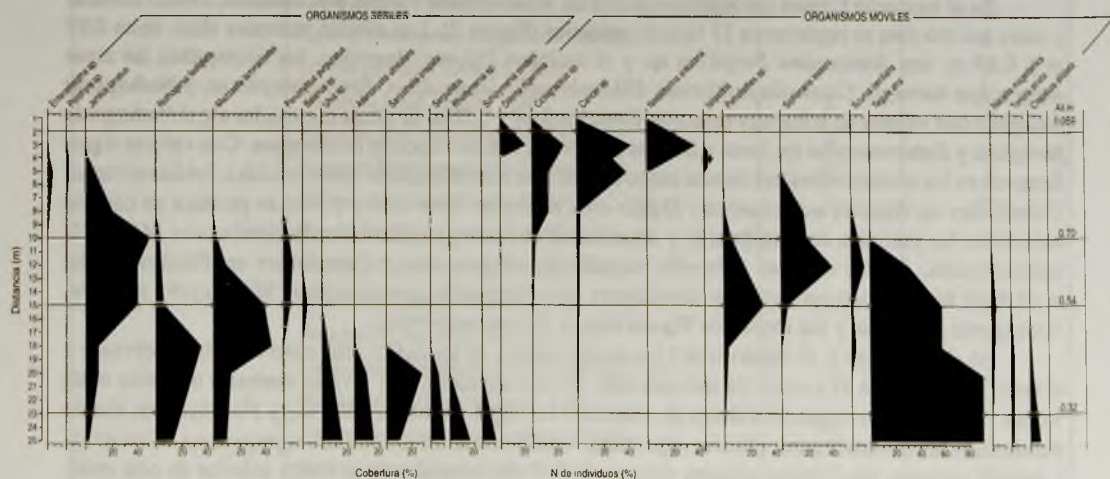
FIGURA 3. Transecto 2.