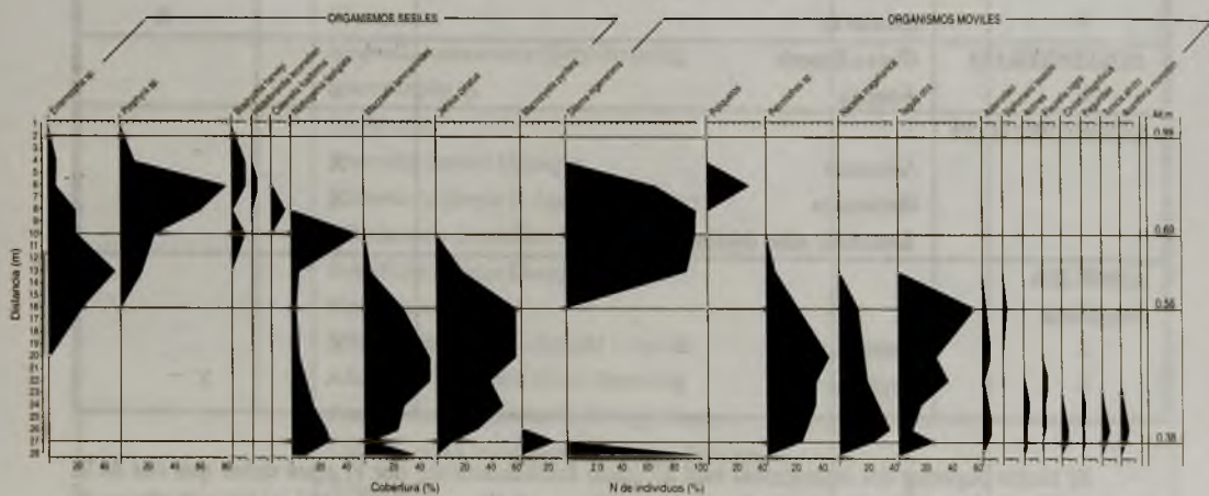
FIGURA 2. Transecto 1.

laminarioides y Nothogenia fastigiata , y de los moluscos Perumytilus purpuratus , Siphonaria lessoni , Scurria ceciliania y Tegula atra . A este nivel desaparece Nodilittorina araucana y Diloma nigerrima . Hacia los niveles más bajos ( 0,54 – 0,32m ), dominan el molusco Tegula atra , junto a las algas Nothogenia fastigiata y Mazzaella laminarioides y al balánido Jehlius cirratus , especie esta última, que empieza a presentar valores de cobertura menores; también se observó un reemplazo de las especies del género Mazzaella por Sarcothalia hacia el límite inferior de este nivel. Junto a éstas, aparecen también Rhodynenia sp, Ulva sp. Adenocystis utricularis , Schyzimena binderii , un poliqueto Serpulidae, Scurria ceciliania y Petrolisthes sp..Desde los 0,32 hasta los niveles mareales más bajos sigue dominando Tegula atra , la acompaña Crepidula dilatata y Jehlius cirratus , junto a las algas Sarcothalia crispata y Nothogenia fastigiata .