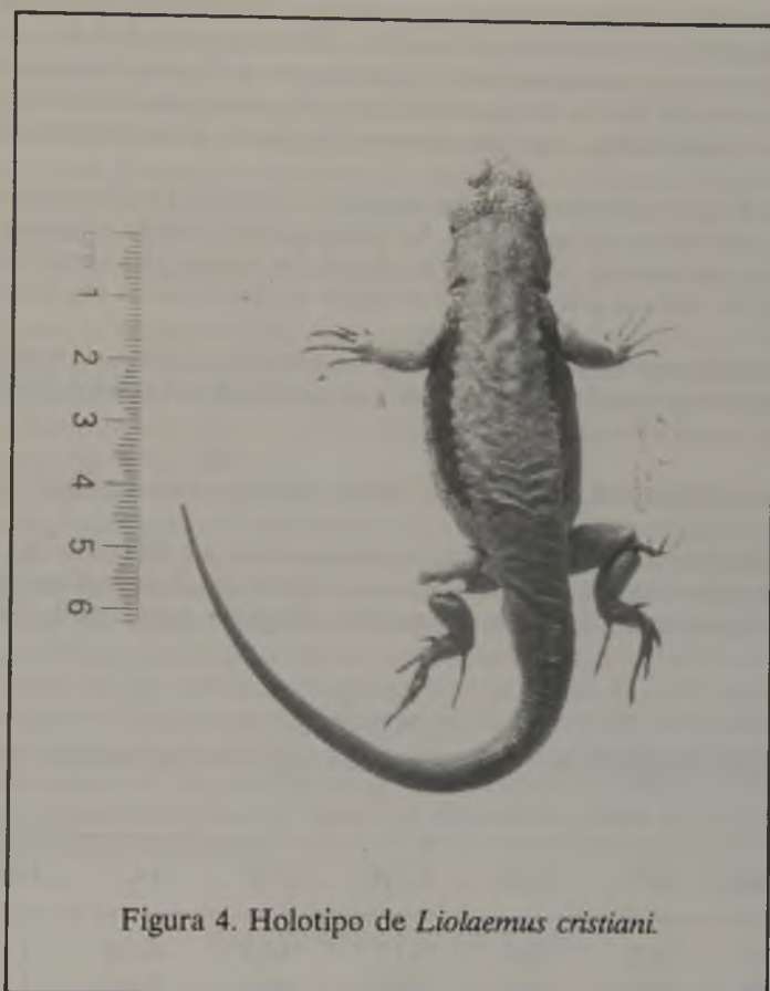
Figura 4. Holotipo de Liolaemus cristiani .

Escamas del dorso redondeadas, ligeramente quilladas e imbricadas, sin escamas pequeñas entre ellas, excepto hacia los flancos en que aparecen estos heteronotos. Las escamas dorsales hacia los flancos con una quilla más modesta que las de la región medio-vertebral. Escamas de los flancos lisas, redondeadas y yuxtapuestas y entre ellas hay numerosos heteronotos. Escamas ventrales de igual tamaño que las dorsales, lisas e imbricadas.