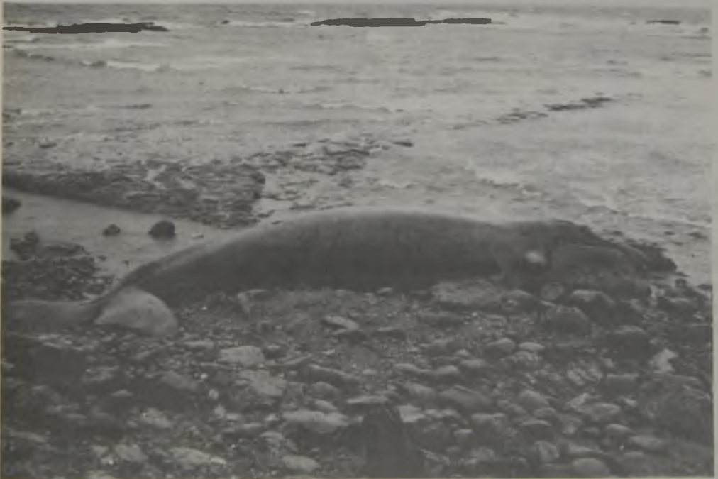
Fig. 2. Situación de la cría de E. australis varada sobre la base rocosa en el área de playa Isla Verde.

Desde 1986 la moratoria mundial que protege a esta especie ha permitido una lenta recuperación de sus poblaciones en las aguas chilenas (Cárdenas et al. , 1987; Brownell et al. , 1989). En agosto de 1989 en Playa Los Reumbes (37°12'S - 73°35'W) Golfo de Arauco, VIII Región (Fig. 1), se establecieron una hembra y su cría (Yáñez et al. , 1989; Canto et al. , 1990), indicio de un posible proceso de recolonización de sus antiguos territorios. Sin embargo, este proceso de crianza no llegó a su fin debido a la instalación de dos balsas para el cultivo del alga pelillo Gracilaria sp. en el centro de la bahía, donde la madre y la cría mantenían la mayor parte de las actividades conductuales y de amamantamiento. Las instalaciones de la infraestructura de cultivo forzaron el desplazamiento de ambos ejemplares a un área denominada Playa Isla Verde, un kilómetro al norte de Playa Los Reumbes. Este sector revestía un alto riesgo para ambos ejemplares, dada su baja pendiente y la conformación rocosa de la plataforma costera. Debido a esta nueva ubicación, asumida por los ejemplares, en la madrugada del 23 de octubre la cría varó siendo encontrada en la mañana del mismo día sobre la base rocosa del área de Playa Isla Verde (Fig. 2).