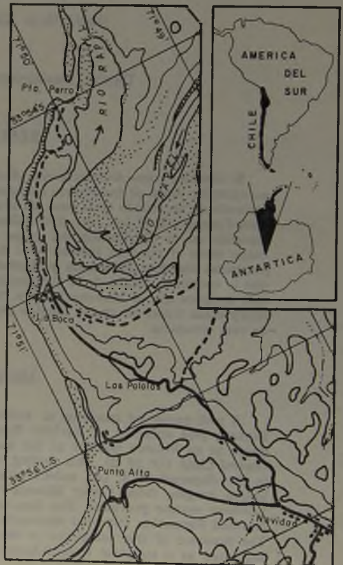
Fig. 1. Architectonica (A.) nobilis karsteni Rutsch proviene de un rodado recolectado en la base del acantilado costero que se extiende al suroeste de Punta Perro ( 33^{\circ} 54' Lat. S, 71^{\circ} 50' Long. O), al sur de la desembocadura del río Rapel. Hoja Navidad. IGM 1968, escala 1:50.000.

Especie tipo: Architectonica ( Architectonica ) perspectiva (LINNÉ) = Trochus perspectivus LINNÉ, 1758: Reciente, Indo Pacífico.