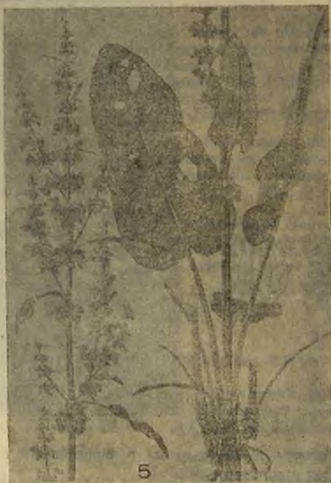
Fig. 3. Chevreulia lycopodioides , de CABRERA, Fl. Patag., Fig. 95, a. planta, b. capítulo, c. flor marginal, d. flor del disco.