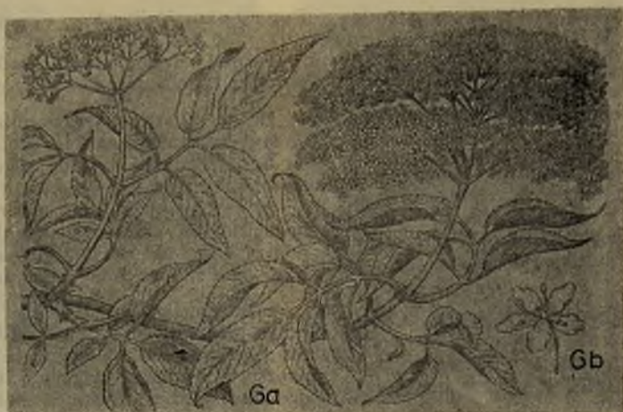
Fig. 6. Sambucus nigra de Font Quer, Pl. Medic., pág. 753, a. hábito reducido, b. flor aumentada.

talos; ovario ínfero generalmente 3-locular, estilo muy corto, estigma 3-lobulado.