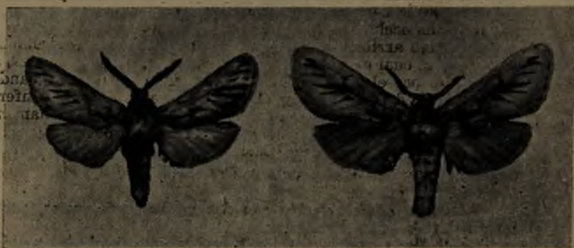
Fig. 2. Breyeriana cistransandina sp. n. ♂ y ♀.

Tórax con el disco abundantemente piloso, con pelos negros entremezclados con pelos cremoso-grisáceos que forman un grueso pincel terminal; tégulas de color gris humo, resultante de la mezcla de pelos blanco-amarillento sucio y negro; patagia grisácea con tres líneas negras delgadas, transversales, la última de ellas marginal; metatórax con dos mechones de largos pelos dispuestos transversalmente desde la axila del ala hacia la línea media donde se entrecruzan.