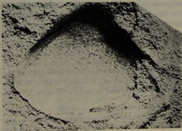
Nactra subangulata , ejemplar de Navidad 3/1.