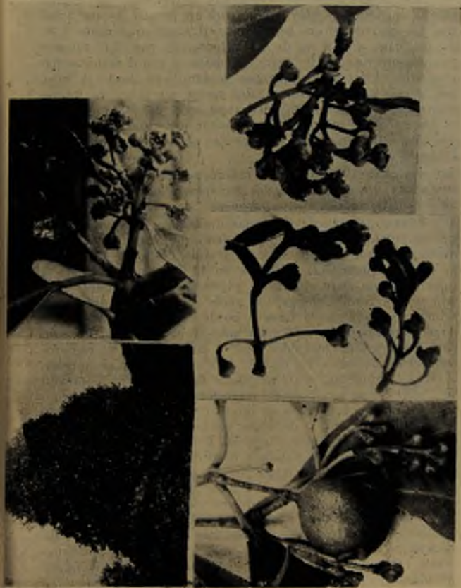
Lám. III. Un queulé joven. Inflorescencias con flores abiertas, botones y un fruto: Las dos inflorescencias de la figura del centro muestran las hojas reducidas, que van en la base de los pedúnculos florales. Todo de tamaño reducido.