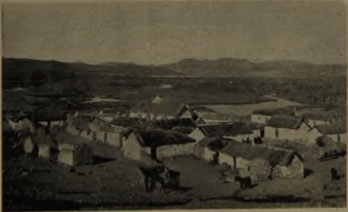
N.º 2.—Caserío de Parinacota, al fondo las lagunas y bofedales.