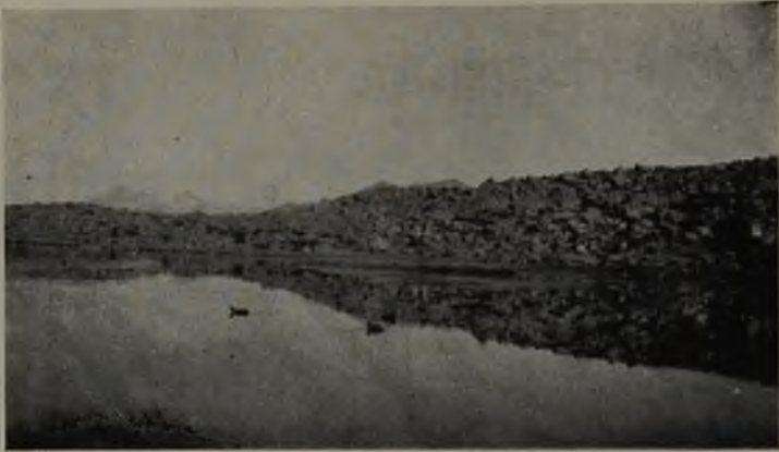
N.º 3.— Fulica gigantea en la laguna N. de Parinacota, al fondo se destaca el volcán Tahapaca.