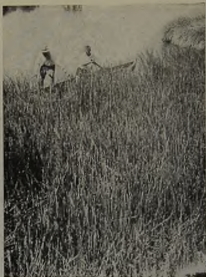
N.º 7.—Pajonales en el río San Salvador, cerca de su confluencia con el Loa. Biotopo de Tachuris rubrigastra y de Phleocryptes melanops .