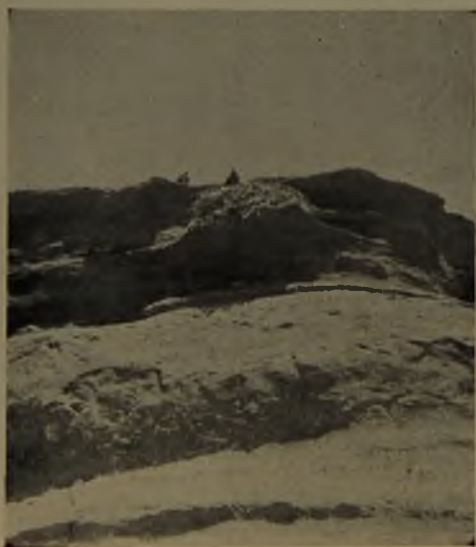
N.º 6.—Nido de Buteo p. polyosoma en Puerto Viejo.