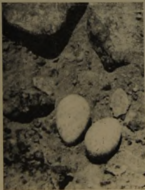
N.º 10.—El nido y huevos de Larus modestus tomados de cerca.