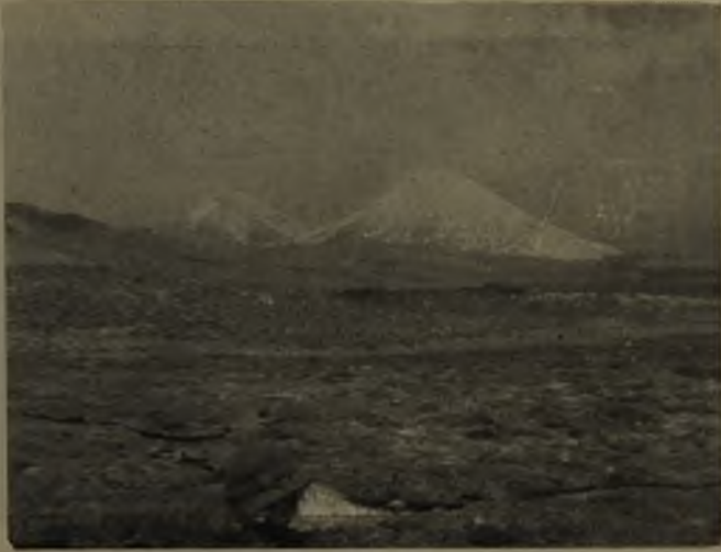
N.º 1.—Los volcanes Payachata, cordillera de Arica.