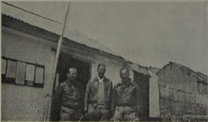
N.º 4.—Los autores en el pueblo de Putre.