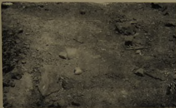
N.º 9.—Nido de Larus modestus , con dos huevos.