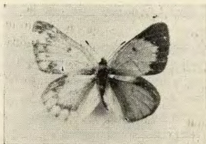
Fig. 2. Colias vauthieri , Guér., hermafrodita

Se trata de una Colias cuya mitad izquierda es hembra y la derecha, macho. En esta especie que presenta un gran dimorfismo sexual, un hermafrodita es notable. Las dos alas izquierda, por arriba, son blanco-verdosas, con un ribete negro que presenta una serie de manchas marginales del color del fondo. Las alas derechas son anaranjadas, con un ribete marginal negro. La mancha discoidal del ala anterior es negra y la del ala posterior, rojiza. Por debajo las alas izquierdas son como en la hembra normal. El ala anterior derecha es como en el macho, pero la posterior es como en la hembra, presentando sí muchas escamas anaranjadas que la disfrazan, podríamos decir, de masculina. (Fig. A.)