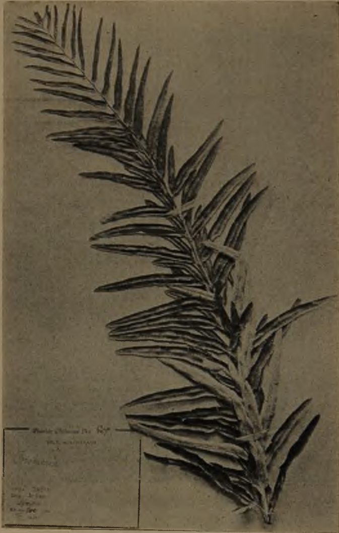
Fig. 2.— Trismeria trifoliata (Col. Dr. Werdermann)

J. W. Sturm la indica de Chile como Gymnogramme trifoliata Desv. en Enum. plant. vasc. cryp. Chilensium, 1858, p. 14.