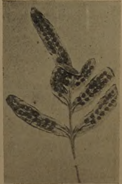
Fig. 3.— Polypodium Espinosae \frac{1}{2}

Todos los helechos de la colección del Dr. Johnston fueron determinados por el Dr. C. A. Weatherby del Gray Herbarium y publicados en Contributions from the Gray Herbarium of Harvard University, 85, 1929, págs. 13-17, los de Taltal y en la pág. 143 los de la costa del salitre, en Tocopilla; una lámina (n.º 2) ilustra el trabajo en la cual están representadas las dos novedades científicas: la fig. 1, Asplenium fragile var. lomense y la 2, Polypodium Espinosae . Nosotros acompañamos también una lámina y figura que muestran diferentes aspectos de la planta.