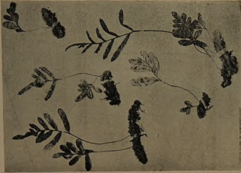
Polypodium Espinosae \frac{1}{2}