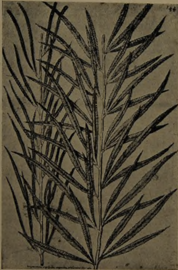
Fig. 1.— Trismeria trifoliata (Lámina de Plumier)

A. J. Cavanilles en « Descrip. plant. », 1802, p. 241, la cita como Acrostichum trifoliatum , da de ella una corta descripción y dice que «se cría junto a los arroyos de Arica en el Reyno de Chile y en otras partes de América».